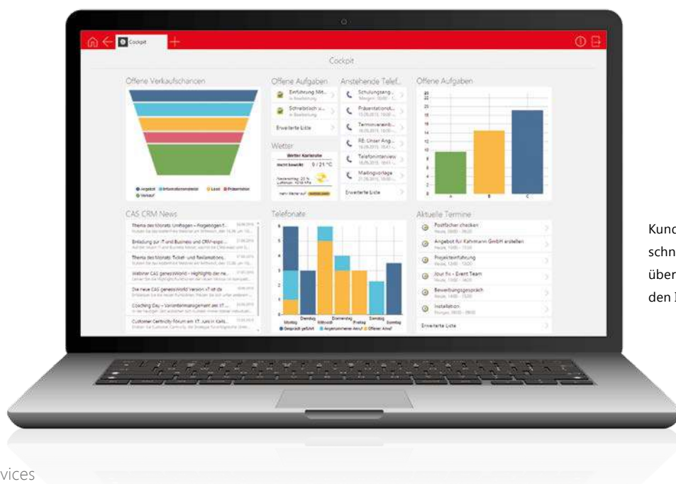
Kund Cockpit – schneller Überblick über alle entscheidenden Informationen.

Eine zentrale Datenbasis für alle erleichtert sowohl die Terminkoordination, Aufgabenverwaltung, Dokumentenbearbeitung als auch die gemeinsame Projektarbeit und Lösung von Supportfällen. Ihre Mitarbeiter erteilen kompetente Auskünfte, treffen fundierte Entscheidungen und erleben spürbare Erleichterung in ihrer täglichen Arbeit. Das motiviert und spart Zeit für das Wesentliche – Ihre Kunden.